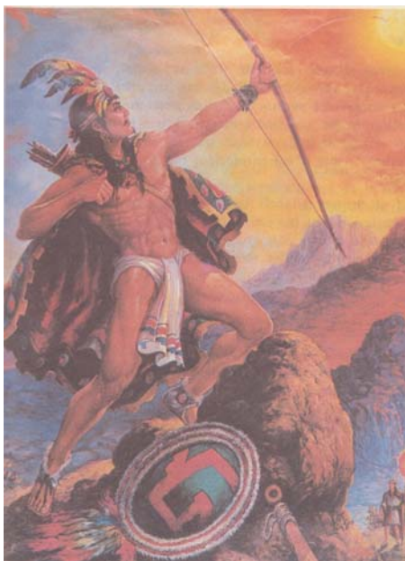
Mixtecatl, Flechador del Sol.

Tanto Fray Juan de Torquemada como Fray Toribio de Motolinía recogieron entre la población esa creencia, agregando que Mixtecal, fue el quinto hijo de Iztac Mixcoatl e Itlancue. Otros afirmaban que brotó de las cuevas de Apoala y de ahí se fue a conquistar la mixteca, pero como no halló con quien pelear se puso a luchar contra el Sol, con quien peleó todo un día y al atardecer, cuando el crepúsculo dominaba el horizonte, el guerrero creyó que vencía al Sol y entonces proclamó su reino. 17